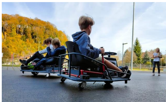
Crazycarts-Rennen bei der Eröffnung des neuen Schulhauses im Rüegsauschachen

Auch im Jahre 2022 trug das Jugendwerk dazu bei, dass die Kinder und Jugendlichen aus Brandis viele unvergessliche Momente erleben konnten. Die Jugendarbeit hat bei manchen Kindern und Jugendlichen mittlerweile einen hohen Stellenwert – viele der Kinder und Jugendlichen in Brandis nehmen regelmässig an den Angeboten des Jugendwerks teil und haben sichtlich Spass dabei, neue Erfahrungen zu machen und über sich selbst hinauszuwachsen.