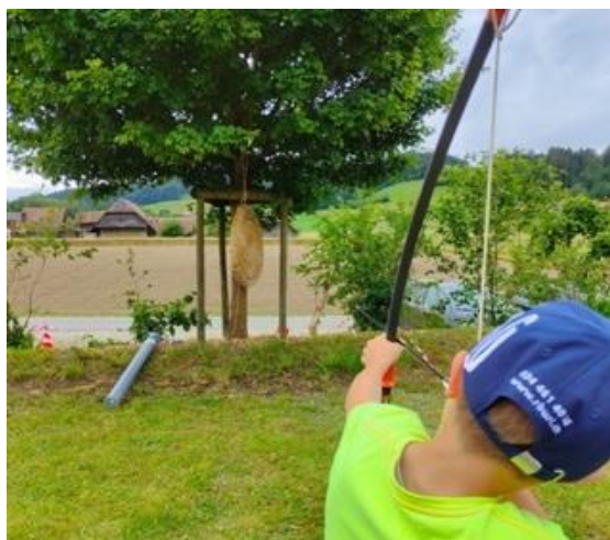
Armbrustschiessen beim «Chilbi Nachmittag»

Nebst dem Mitwirken bei der Schulschlussfeier wurden den SchülerInnen vom Kindergarten bis in die 6. Klasse auch diverse vielseitige und unterhaltsame Ferienaktivitäten geboten, was ebenfalls auf grossen Anklang bei den Kindern traf.