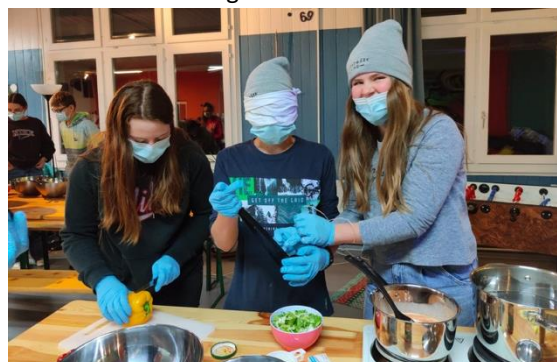
Kreative Hände beim Kochduell

Im Jugendtreff «Pura Vida» blieb den Jugendlichen das Angebot «Gala Night – Limousine Special» in besonderer Erinnerung. 65 TeilnehmerInnen besuchten den Jugendtreff an diesem Abend. Im Rahmen der «Gala Night» wurde für die Jugendlichen ein Limousinen-Shuttledienst von Lützelflüh nach Brandis und retour organisiert, was bei den Teilnehmenden für grosse Begeisterung sorgte. Im Jahr 2022 waren im Jugendtreff durchschnittlich 20-35 Teilnehmende anzutreffen. Spannende Angebote wie eine Color Party-Night, eine Rollschuh-Disco, eine Neon-Party, eine Retro-Night und ein Kochduell sind nur einige Highlights der Angebotspalette, welche den SchülerInnen der 7.-9. Klasse im Jahr 2022 geboten wurden.