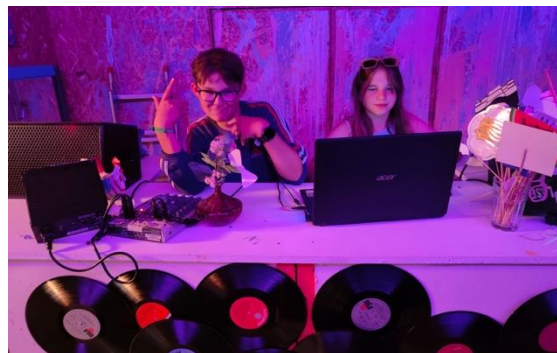
Gute Stimmung im Jugendtreff Pura Vida

Es ist sehr erfreulich zu erleben, wie die jungen Menschen bei der Planung der Angebote tolle Ideen mitbringen; Wie sie während den Anlässen Verantwortung übernehmen und nach den Angeboten beim Aufräumen aktiv mithelfen.