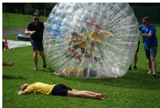
Am ersten Tag Einwärmen beim Megalager!

Für die TeamlerInnen wurde als Dankeschön eine Erlebnismacht organisiert, die zusammen mit allen anderen 16 Standorten des Jugendwerks stattfand. Insgesamt reisten 73 Freiwilligen in deren «Bad Taste-Outfit» nach Münchenbuchsee, um dort im Bunker zu guter Musik ausgelassen zu feiern. Ein weiteres Highlight an diesem Abend stellte das Geländegame im Wald dar.