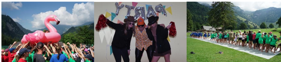
Im Jugendwerk ziehen junge Menschen am gleichen Strick, lassen es knallen und staunen über ihren eigenen Mut.